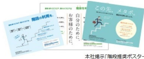
本社掲示「階段推奨ポスター」