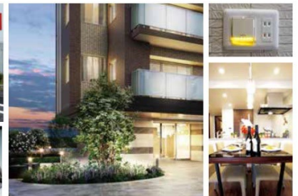
省エネルギー工事実施