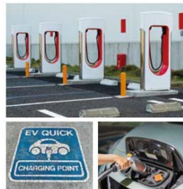
EV自動車用充電設備提案